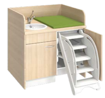
H = hauteur sur plan