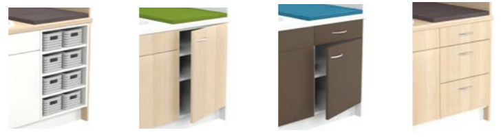
3 étagères (panières A784 en option, voir p. 158) 1 porte, 2 étagères réglables 1 porte, 1 tiroir 3 tiroirs, fermeture amortie